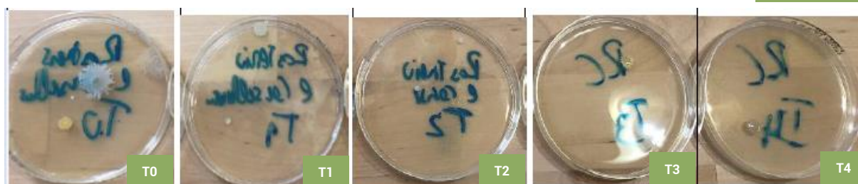
Tabela 1 – Tabela de Resultados